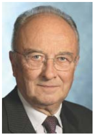
Verfassungsrechtler Prof. Rupert Scholz

experte und Verfassungsrechtler Prof. Dr. Rupert Scholz ist überzeugt davon, dass ein absolutes Rauchverbot verfassungswidrig sei und neue Klagen der Geschädigten nach sich ziehen würde: „Das Gesetz würde mehrere Grundrechte verletzen wie etwa das Recht auf persönliche Freiheit.“