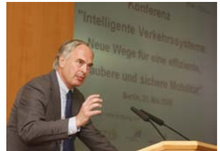
BDI-Präsident Hans-Peter Keitel bei der Konferenz »Intelligente Verkehrssysteme«

» Deutschland muss innovative Verkehrssysteme rasch und konsequent einführen.«