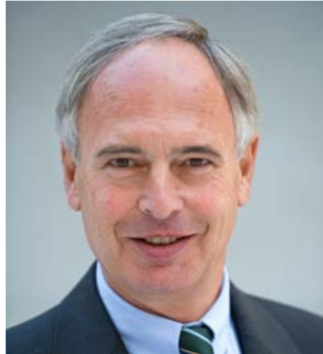
BDI-Präsident Hans-Peter Keitel.

Wir haben im Gegensatz zu früheren Krisen keine Ausweichmöglichkeiten. Das ist, als ob es auf der Autobahn einen Unfall mit Vollsperrung gibt - man steht im Stau, kann ihn weder auf dem Standstreifen noch über Landstraßen umfahren.