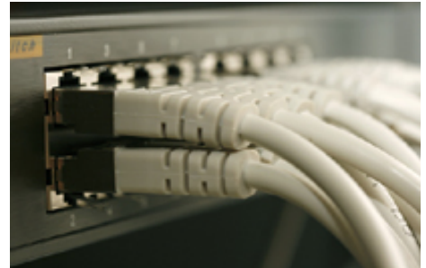
Regulierung unterstützt den fairen Wettbewerb der netzgebundenen Industrien.

Die ökonomischen Grundregeln zur Öffnung von Netzmärkten müssen als Maßstab einer intelligenten Regulierung beachtet werden. Dadurch entsteht Planungssicherheit, die zum Vertrauen der Märkte beiträgt und Impulse für Investitionen, Wachstum und Beschäftigung freisetzt.