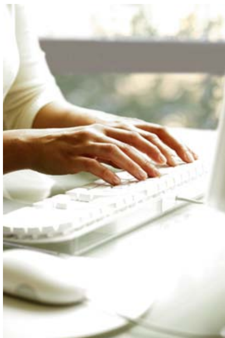
Moderne Kommunikationstechnologien machen das Gesundheitssystem effizienter und sicherer.

Die Politik muss den Gesundheitsmarkt von Überregulierung befreien und für technische Innovationen öffnen: Die geplante Einführung der elektronischen Gesundheitskarte in diesem Jahr wäre ein guter Anfang, um Angebote und Leistungsstrukturen zu verbessern. Berichte vom Patienten könnten künftig in elektronischer Form vom behandelnden Arzt schnell und zuverlässig abgerufen werden. Mehrfachverordnungen und kostenintensive Doppeluntersuchungen würden vermieden. In der Verwaltung