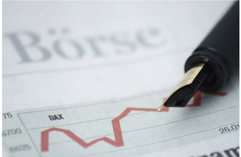
Die Finanzmarktkrise verursacht Liquiditätsengpässe bei den Unternehmen.

Einen Überblick über die wesentlichen Programmbausteine bekommen Sie im Internet unter http://www.bdi.eu/finanzkrise .