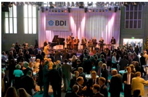
BDI-Tag der Deutschen Industrie 2008: Der BDI diskutiert mit Politik und Gesellschaft.