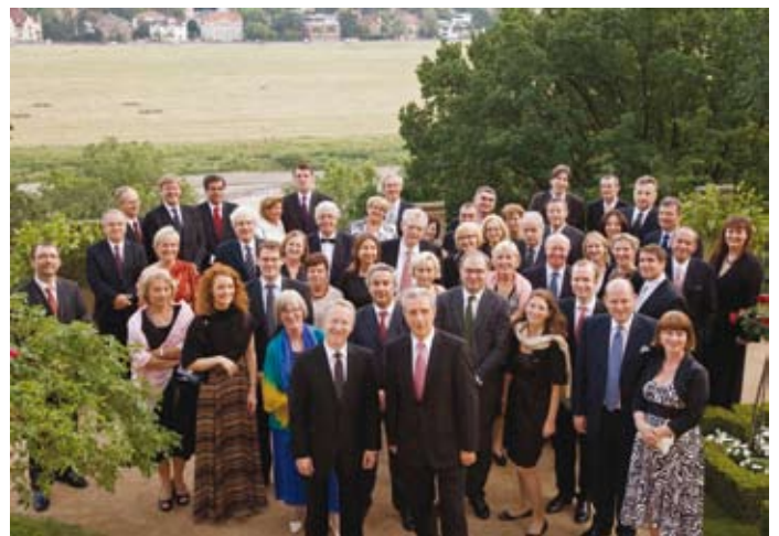
CDEIF-Teilnehmer 2008 gemeinsam mit dem sächsischen Ministerpräsidenten Stanislaw Tillich

Bundesland verfügt über ein dichtes Netzwerk an kleinen und mittleren Unternehmen – davon schon allein an die 500 in der Automobilbranche – sowie über eine Vielzahl wissenschaftlicher Institute und Forschungseinrichtungen.