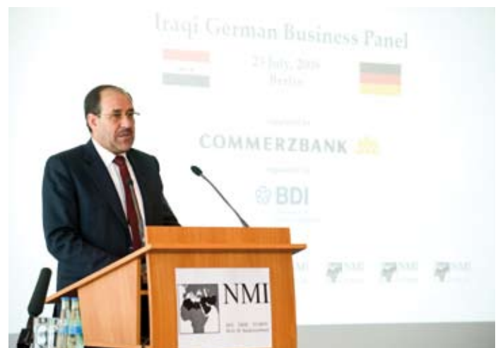
Ministerpräsident des Irak, Nouri al-Maliki

Beim Wiedereinstieg in den irakischen Markt gilt es jedoch,