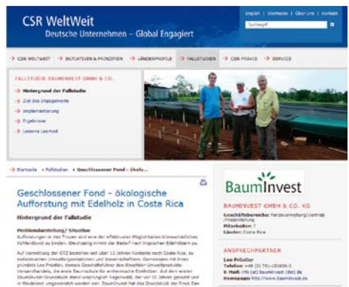
Die Internetseite www.csr-weltweit.de