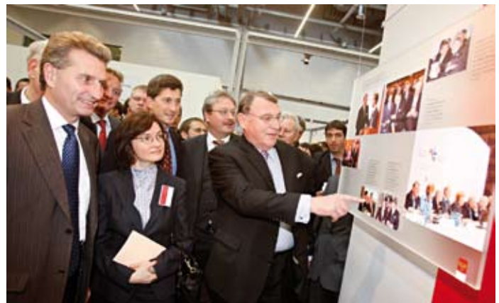
Günther Oettinger, Elvira Nabiullina, Klaus Mangold beim Messerungsgang

»Die Deutschen wissen wenig über Sibirien« – konstatierte der Botschafter der Russischen Föderation in Deutschland,