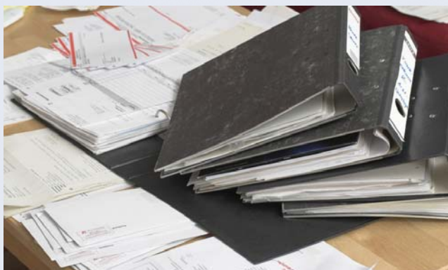
Weniger Bürokratie ist das Ziel von ELENA

Das ELENA-Verfahrensgesetz sieht vor, dass die für die Beantragung von Arbeitslosengeld I, Eltern- und Wohngeld relevanten Entgeltdaten ab dem 1. Januar 2009 monatlich vom Arbeitgeber elektronisch an den „ELENA-Datenpool“ (sog. Zentrale Speicherstelle) zu melden sind. Dieser ist bei der Deutschen Rentenversicherung Bund angesiedelt. Dort werden alle Entgeltdaten der Beschäftigten zentral gespeichert. Während einer Übergangsphase, die bis zum 31. Dezember 2011 dauert, sind jedoch weiterhin auch die entsprechenden Papierbescheinigungen auszustellen. Ab 1. Januar 2012 entfallen dann die Papierbescheinigungen für die Sozialleistungen Arbeitslosengeld I, Eltern- und Wohngeld. Die leistungsgewährenden Behörden rufen ab diesem Zeitpunkt die zur Leistungsberechnung notwendigen Informationen direkt bei der Zentralen Speicherstelle ab.